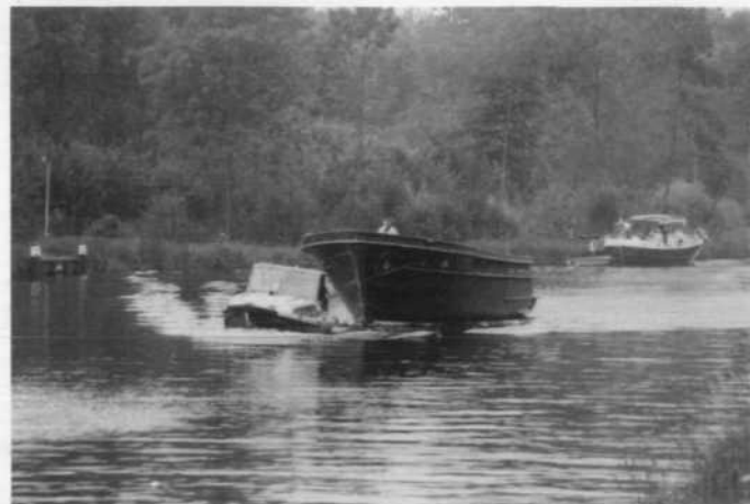
★ Het casco op weg naar de straler.